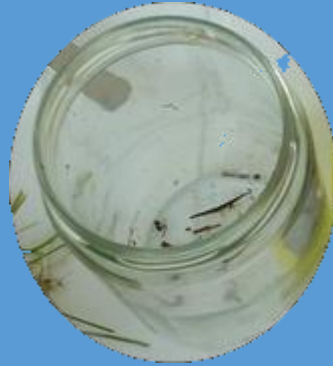
Un grand bocal