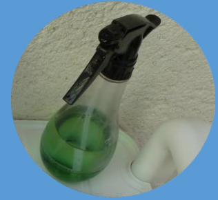
Un vaporisateur d'eau