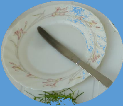
1 assiette 1 couteau