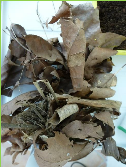
Des feuilles mortes