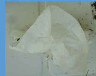
1 feuille d'essuie-tout