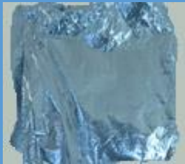
Un morceau de papier aluminium plié en 4